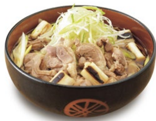
◀鴨南蛮そば クーポン利用 750円 (通常1,050円)