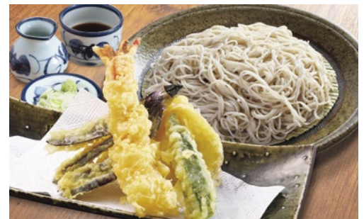
▲天ぷらそば クーポン利用 590円 (通常890円)