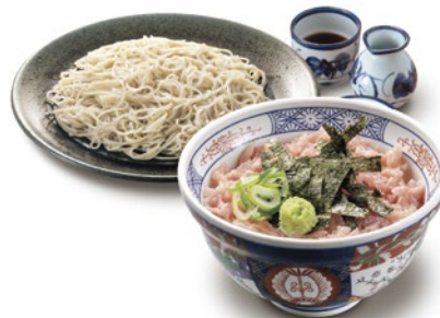
◀もりそばと まぐろたたき丼セット クーポン利用 700円 (通常1,000円)