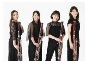
10月 ファゴットカルテットAvance