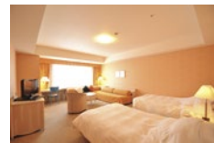
ロイヤルツインルーム

ホテル周辺には観光・レジャースポットもあり、南魚沼を満喫できます。 地産食材をふんだんに使用したお食事をご用意してお待ちしております。