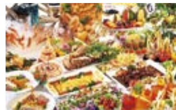
夕食ブッフェ(イメージ)