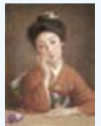
岡田三郎助(ダイヤモンドの女) 1908年 福富太郎コレクション資料室