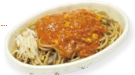
イタリアン(イメージ)