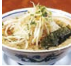
ラーメン亭吉相 ラーメンこってり

ラーメン亭 吉相 県庁前店/物見山店/イオンモール新潟南店 ラーメン亭 一兆 黒埼店/河渡コメリ店 ラーメン亭 孔明 長潟店