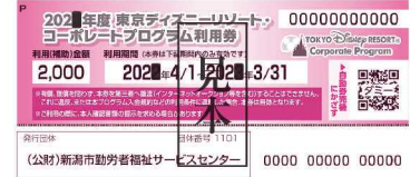
コーポレートプログラム利用券

●利用券を第三者へ譲渡・転売することはできません。違反した場合、利用券は無効となります。