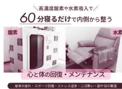
60分寝るだけで内側から整う

※他の割引等の併用不可 頭痛・冷え・睡眠不足・日々の疲労にお悩みの方へ。高気圧酸素BOXで血流を巡らせて代謝をサポート、全身を芯から回復させます。習慣でスッキリ軽やかな毎日へ。肌のくすみ・美肌ケアに水素吸入も人気です！仕事帰りや買い物ついでのスキマ時間で手軽にリフレッシュ&リセットできます☆法人様向け福利厚生プランもご用意ですので、お気軽にご相談・ご来店ください。