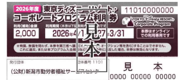
コーポレートプログラム利用券

利用券にある個券番号・オンライン用コードを入力すると、補助金額（2,000円）が差し引かれた金額で決済されます。