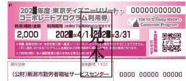
コーポレートプログラム利用券

●利用券を第三者へ譲渡・転売することはできません。違反した場合、利用券は無効となります。